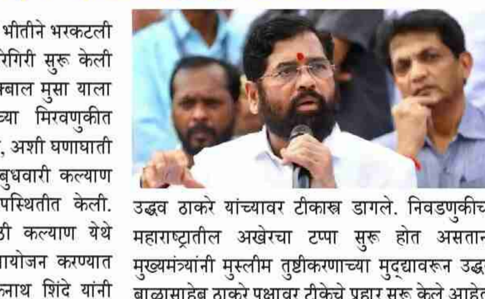
उद्धव ठाकरे यांच्यावर टीकास्र डालले. निवडणुकीचा महाराष्ट्रातील अखेरचा टप्पा सुरू होत असताना मुख्यमंत्र्यांनी मुस्लीम टुष्टीकरणामुळे मुद्दावरून उद्धव बाळासाहेब ठाकरे पक्षावर टीकेचे प्रहार सुरू केले आहेत.