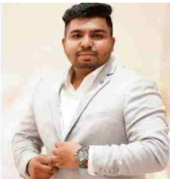
● भिवंडी : ठाणे भिवंडी रस्त्यावर अज्ञात ट्रकच्या धडकेत व्यवसायाने आर्किटेक्चर

आले. "आम्ही, भारताचे नागरिक, आपल्या देशाच्या अहिंसा व सहिष्णूतेच्या परंपरेविषयी दृढ निष्ठा बाळगून याव्दारे, सर्व प्रकारच्या दहशतवादाचा व हिंसाचाराचा आमच्या सर्व शक्तीनिशी मुकाबला करण्याची गांभीर्यपूर्वक प्रतिज्ञा करीत आहोत" अशी प्रतिज्ञा घेत महापालिका अधिकारी, कर्मचारीवृंदाने "आम्ही प्रतिज्ञा