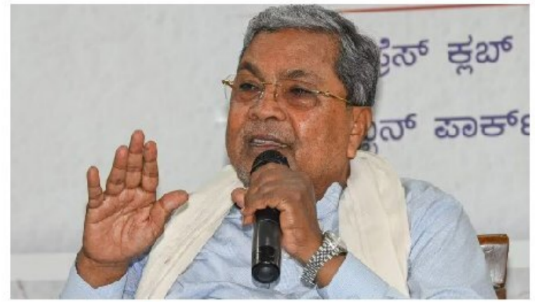
● कर्नाटक, प्रतिनिधी :

महाराष्ट्रात मराठी भाषेचे पतन होत असताना इतर राज्य मात्र त्यांची भाषा जतन करण्यासाठी पुढाकार घेताना दिसत आहेत. कर्नाटक हे राज्य मातृभाषेसाठी पूर्वीपासून आग्रही असल्याचे अनेकदा दिसले आहे. सीमावर्ती भागातील मराठी बांधवांनी कन्नडमध्ये व्यवहार करावेत, यासाठीही अनेकदा तिथे संघर्ष उडालेला आहे. आता कर्नाटकचे मुख्यमंत्री सिद्धरामय्या यांनी कन्नडभाषेसाठी केलेले एक आवाहन चर्चेचा विषय ठरत आहे. कन्नडभाषेची आपल्या भाषेचा