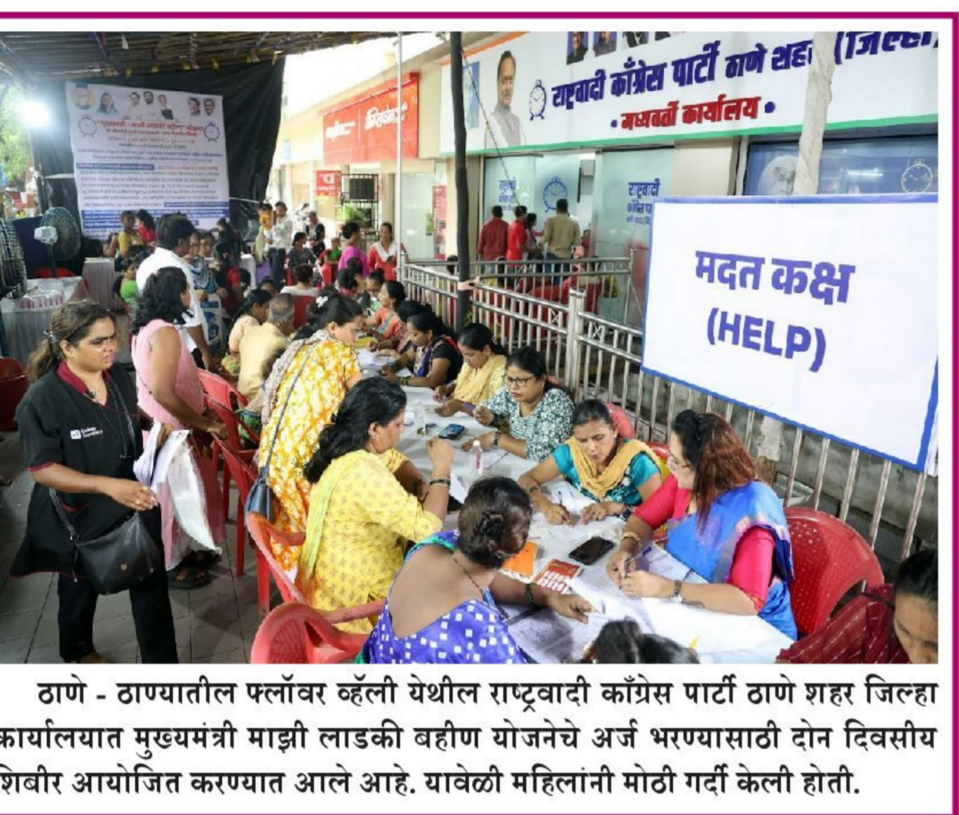
ठाणे - ठाण्यातील फ्लॉवर व्हॅली येथील राष्ट्रवादी काँग्रेस पार्टी ठाणे शहर जिल्हा कार्यालयात मुख्यमंत्री माझी लाडकी बहीण योजनेचे अर्ज भरण्यासाठी दोन दिवसीय शिबीर आयोजित करण्यात आले आहे. यावेळी महिलांनी मोठी गर्दी केली होती.

दाखल झाल्या होत्या. या महिलांच्या शहराबाहेरील होते. त्यांच्यावर उपचार १० नवजात बालकांचे वजन एक किलो सुरु असतानाच त्यांचा मृत्यू झाला वजनापेक्षा कमी होते. त्यामुळे मृत्यू असल्याचा दावा रुग्णालय प्रशासनाने झालेल्या २१ बालकांपैकी १९ बालके केला आहे.