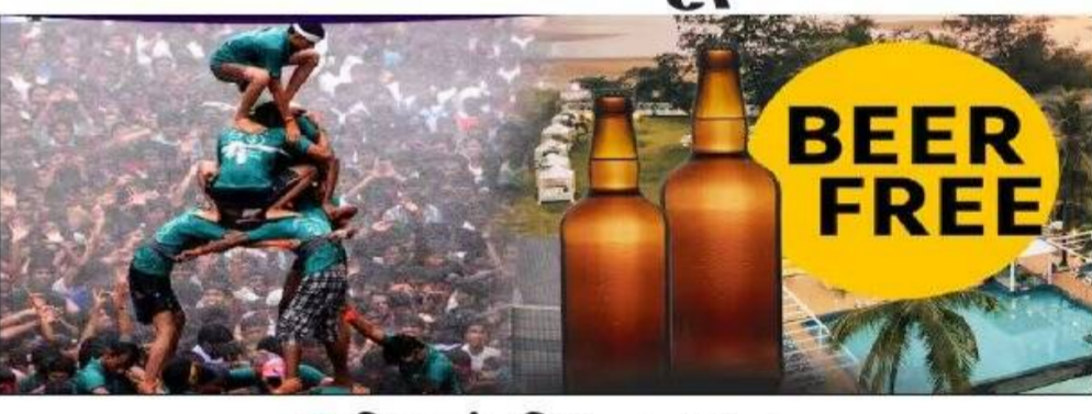
सण, उत्सव म्हटलं की लोकांमध्ये उत्साह असतो, वेगळाच आनंद आणि उत्सवाची तयारीदेखील सुरु असते. या उत्सवात सहभागी होण्यासाठी सर्वजण आपलं योगदान देत असतात. या काळात मार्केटमध्ये तेजी पाहायला मिळते, बाजारात खरेदीसाठी रेलचेल असते तर दुकानदार किंवा विक्रेत्यांकडून विविध ऑफर देण्यात येतात. नुकतेच रक्षाबंधन सणाचा उत्साह देशभर पाहायला मिळाला. महाराष्ट्रात राज्य सरकारच्या लाडकी बहीण योजनेमुळे यंदाचा रक्षाबंधन सण मोठ्या उत्साहात आणि बहिर्गीना आनंद देणारा ठरला. पान २ वर