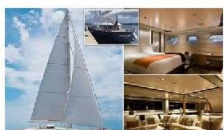
इटलीतील सिसिली बेटाजवळ सोमवारी वादळामुळे बसियनची एक लकडगरी नौका