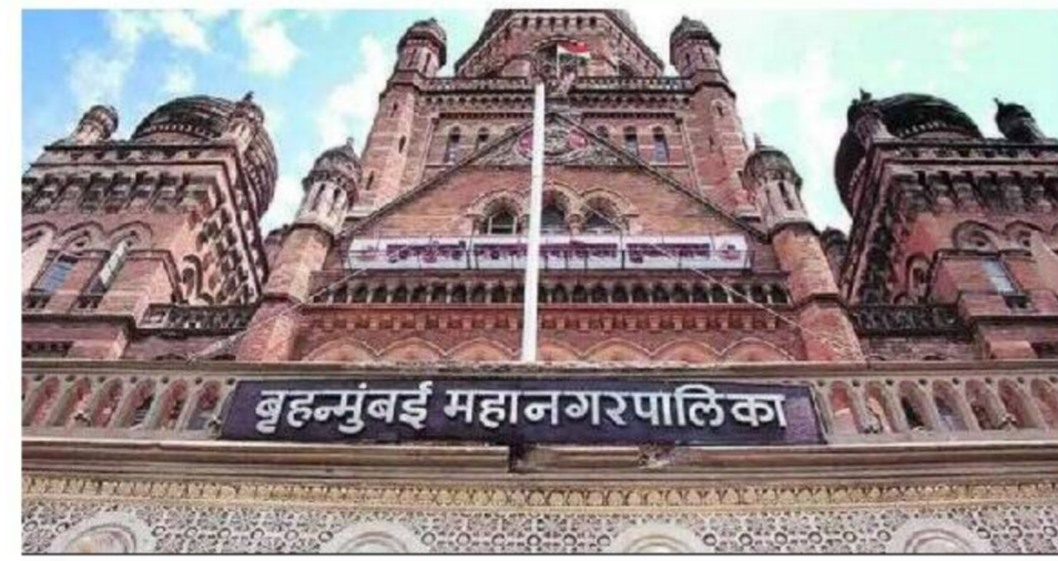
भरली जातील. फेरीवाल्यांच्या महापालिकेला फटकारल्यानंतर विषयावरून उच्च न्यायालयाने जून महिन्यात प्रशासनाने मुंबईत

येत्या काळात मुंबईतील फेरीवाल्यांवरील कारवाई अधिक तीव्र होण्याची शक्यता आहे. मुंबई महापालिका प्रशासनाने अतिक्रमण निर्मूलन निरीक्षकांची ११८ पदे भरण्याचे ठरवले आहे. लिपिक वर्गातून अंतर्गत भरतीद्वारे ही पदे