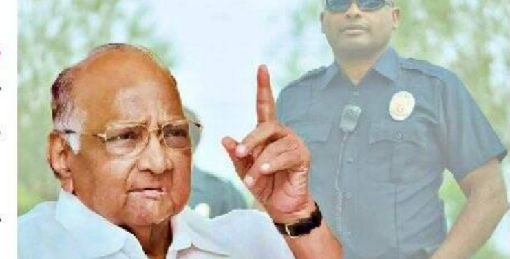
दिला होता. येत्या २-३ महिन्यात महागष्टात विधानसभा निवडणुका होत आहेत. मात्र, गेल्या काही महिन्यांपासून महागष्टात आरक्षणाच्या मुद्द्यावरून मगठा आणि ओबीसी समाजात राजकीय नेत्यांबद्दल नाराजी आहे. त्यामुळे कोणताही अनुचित प्रकार घडू नये, यासाठी खबरदारी घेण्यात येत आहे. सुत्रांकडून मिळालेल्या माहितीनुसार, काही दिवसांपूर्वी सीआरपीएफच्या अधिकाऱ्यांनी शरद पवार यांच्या कार्यालयात सुरक्षा चाचणी केली होती. पान २ वर

येत्या काही महिन्यात महागष्टात विधानसभेच्या निवडणुका होणार आहेत. त्यापूर्वीच राष्ट्रवादी काँग्रेस शरद पवार पक्षाचे राष्ट्रीय