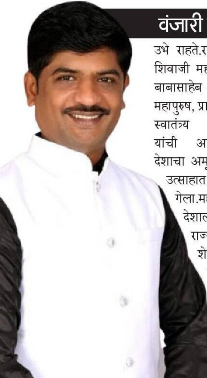
मराठवाडा - जय महाराष्ट्र बोलल्या नंतर अखंड महाराष्ट्राचे चित्र डोक्यासमोर