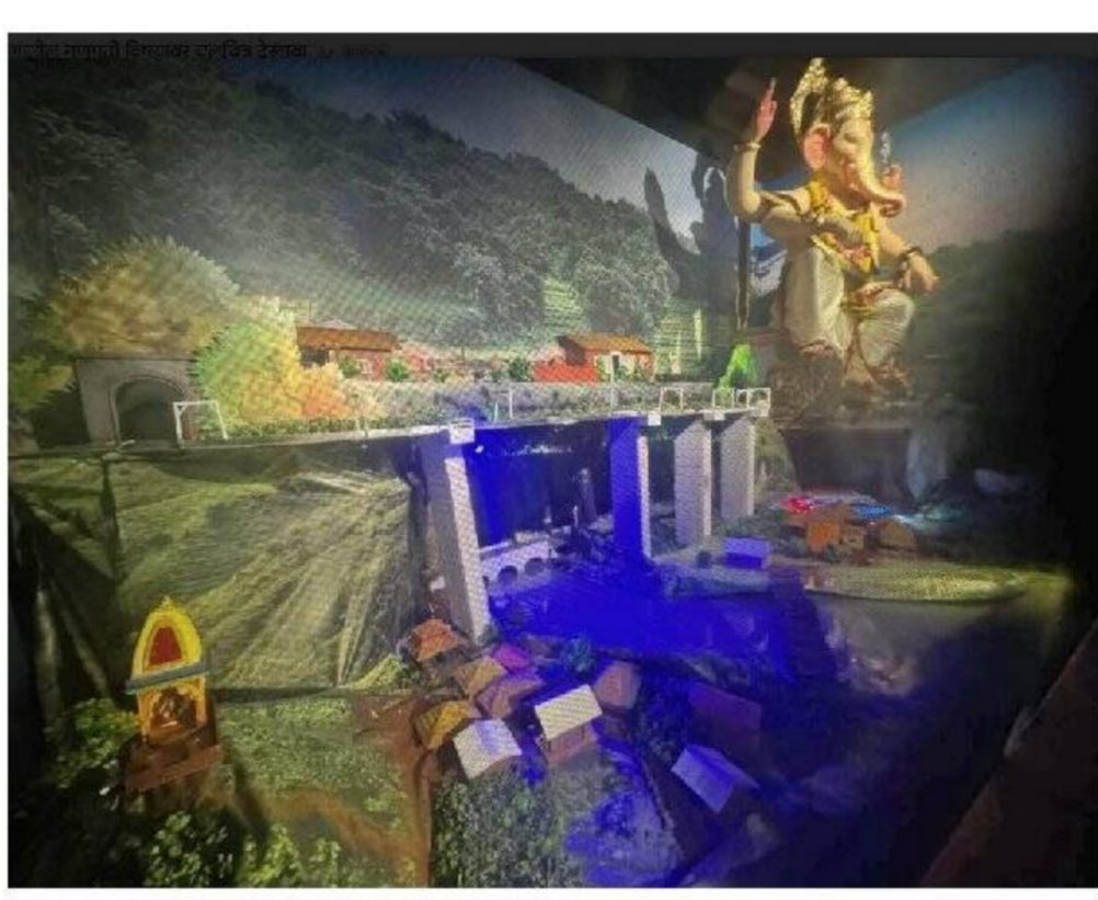
कोकणातील परंपरिक गणेशोत्सव चलचित्र देखावा

कल्याण : मोहने येथील शिवनगरी गणेशोत्सव मंडळाने साकारलेल्या निसर्ग रम्य वैभवशाली कोकणाचा देखावा गणेश भक्तांच्या डोळ्याचे पारणे फेडत असून गणपती उत्सवाचे सांस्कृतिक ठेवा जोपसण्याचा वसा यांचे वास्तव चलचित्रा द्वारे साकरत कोकणाचा गणेशोत्सव पट हुबहुब मांडला आहे.