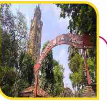
मुंबई विद्यापीठाचे दिसाळ नियोजन, तांत्रिक... पान ६ वर....

सहसंपादक - अनिकेत घनश्याम भंकाळ ■ वर्ष - ०२ ■ अंक १७० ■ पृष्ठे - ०६ ■ ठाणे, मंगळवार, १९ नोव्हेंबर २०२४ ■ रु. २/- ■ RNI.REG. NO. MAHBIL/2023/86118