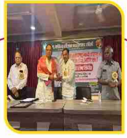
युवकांनो स्वयमश्रित जोपासा - डॉ. उदय... पान ३ वर....

प्रकाशन ठाणे सह एकाच वेळी प्रसारित - पालघर, मुंबई, पुणे, रायगड, सातारा, कोल्हापूर, नाशिक लोकशाहीच्या संरक्षणार्थ