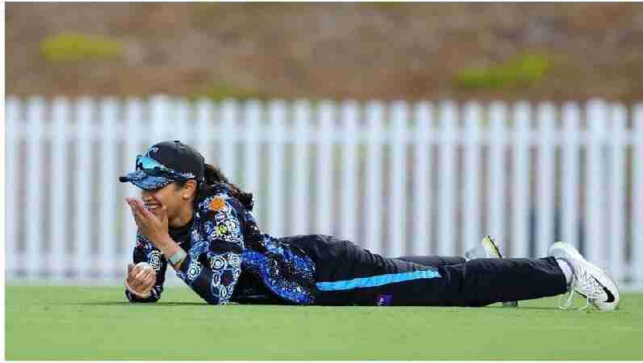
backwards, kept her eyes on the ball, pulled off a dive and made

But Leeson mistimed the ball and managed to spoon it in the air. Mandhana, standing at mid-off, kept her composure to take the catch with both hands. She went