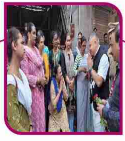
मतदानावर बहिष्कार टाकलेल्या तृतीय... पान ३ वर....