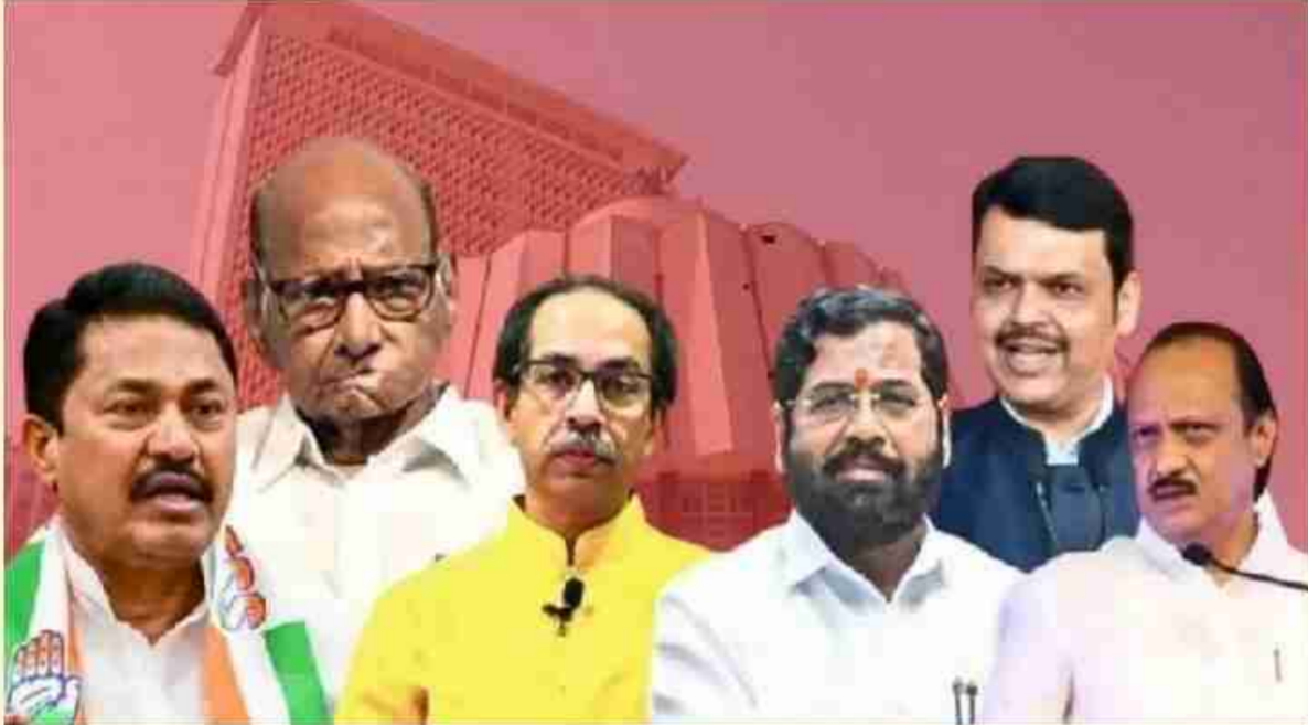
अंदाज सांगण्यात आला आहे. तर भाजप आघाडीला बहुमत मिळण्याची झारखंडसाठी आतापर्यंत ३ एक्झिट पोल आले आहेत. तिन्ही ठिकाणी महाराष्ट्र विधानसभा निवडणुकीसाठी

महाराष्ट्रातील विधानसभेच्या २८८ जागांसाठी आणि झारखंडमधील दुसऱ्या टप्प्यातील ३८ विधानसभा जागांसाठी बुधवारी मतदान प्रक्रिया पार पडली. झारखंडमध्ये १३ नोव्हेंबरला पहिल्या टप्प्यात ४२ जागांवर मतदान झाले. राज्यात ८१ जागा आहेत. दोन्ही राज्यांचे निकाल २३ नोव्हेंबरला लागणार आहेत. तर एका एक्झिटपोलच्या अंदाजानुसार महाराष्ट्रात महाविकास आघाडीची सत्ता स्थापन होण्याचा