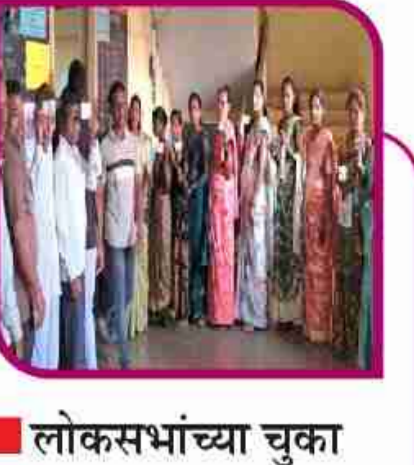
लोकसभांच्या चुका सुधारून विधानसभेत योग्य नियोजनामुळे... पान ६ वर....