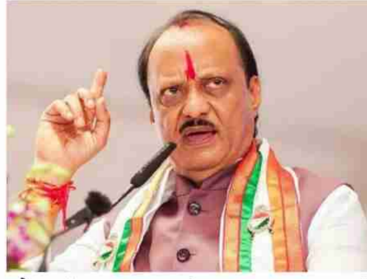
उमेदवारांच्या मतदारसंघात जाऊन गद्दारांना पाडा, असं आवाहन केलं होतं. लोकसभेतील पराभवातून अजित पवारांच्या राष्ट्रवादीने धडा घेत नव्या योजना आखल्या. त्यातच लाडकी बहीण योजनेच्या माध्यमातून महिलांना साद घातली. त्याचाच अजितदादांच्या पक्षाला मोठा फायदा झाला. आता मिळवलेलं यश कायम ठेऊन अजित पवार कशी वाटचाल करणार? याकडे लक्ष लागलं आहे

महाराष्ट्राच्या विधानसभेच्या निकालाने अजित पवारांच्या राष्ट्रवादीने काका शरद पवारांना धोबीपछाड दिलाय. राज्यातील ३८ जागांवर दोन्ही राष्ट्रवादी आमने-सामने आले होते. यामध्ये अजित पवारांच्या राष्ट्रवादीने जोरदार मुसंडी मारली. तर जनतेने खरी राष्ट्रवादी कोणती? यांचे उत्तर दिल्याची प्रतिक्रिया अजित पवारांच्या राष्ट्रवादीने दिलीय. राष्ट्रवादीच्या फुटीनंतर लोकसभा निवडणुकीत शरद पवारांच्या राष्ट्रवादीने मुसंडी मारलेली. एवढेच नाही तर अजित पवारांचं होम पिच असलेल्या बारामतीतून सुप्रिया सुळेंना तब्बल ४८ हजार मतांची आघाडी मिळाली होती. त्यातच शरद पवारांनी अजित पवारांच्या राष्ट्रवादीच्या उमेदवारांच्या मतदारसंघात जाऊन गद्दारांना पाडण्याचं आवाहन केलं होतं.