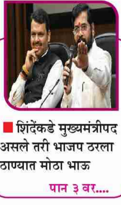
शिंदेकडे मुख्यमंत्रीपद असले तरी भाजप ठरला ठाण्यात मोठा भाऊ पान ३ वर....