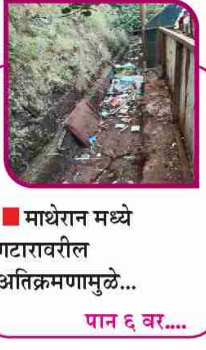
माथेरान मध्ये गटारावरील अतिक्रमणामुळे... पान ६ वर....

सहसंपादक - अनिकेत घनश्याम भंकाळ ■ वर्ष - ०२ ■ अंक १७५ ■ पृष्ठे - ०६ ■ ठाणे, सोमवार, २५ नोव्हेंबर २०२४ ■ रु. २/- ■ RNI.REG. NO. MAHBIL/2023/86118