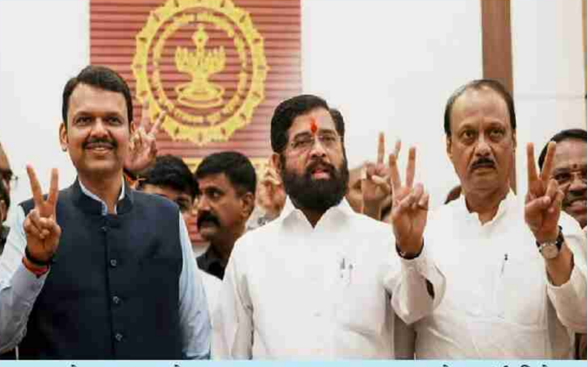
सत्तास्थापनेचा दावा केला जाणार सपाटा लावला आहे. सूत्रांनी दिलेल्या आहे. त्यामुळे महायुतीने बैठकांचा माहितीनुसार, राज्यात एक मुख्यमंत्री

विधानसभा निवडणुकीत महायुतीला मोठे यश मिळाले. या निवडणुकीत महायुतीने थेट २३० चा आकडा गाठला. या निकालानंतर आता महायुतीच्या सत्ता स्थापनेच्या हालचालींना वेग आला आहे. यामुळे महायुतीच्या वरिष्ठ नेत्यांच्या गाडीभेटी वाढल्या आहेत. सागर बंगलावर देवेन्द्र फडणवीस यांच्या भेटीसाठी देखील आमदारांची रेलचेल वाढली आहे.