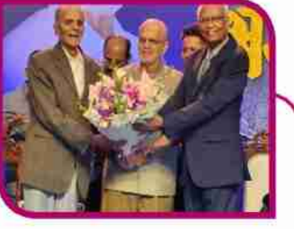
हरित क्रांतीतील स्वामिनाथन यांच्याप्रमाणेच जैवइंधन क्रांतीत... पान ६ वर...

सहसंपादक - अनिकेत घनश्याम भंकाळ वर्ष - ०२ अंक १७८ पृष्ठे - ०६ ठाणे, गुरुवार, २८ नोव्हेंबर २०२४ रु. २/- RNI.REG. NO. MAHBIL/2023/86118