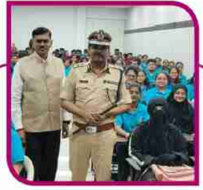
सर्वा परीक्षांना सकारात्मकतेने सामोरे जा... पान ३ वर...