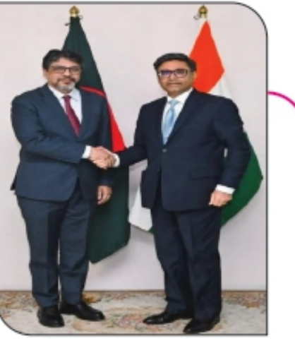
■ परराष्ट्र सचिवांनी दिल्ली बांगलादेशला भेट पान ५ वर...