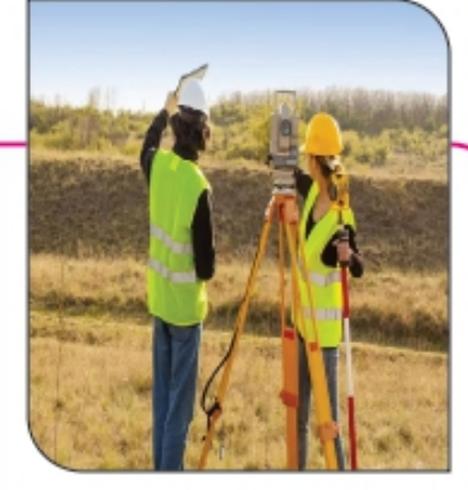
■ जमीन मोजणीसाठीच्या फी मध्ये वाढ, मोजणीच्या निकषात बदल...! पान २ वर...