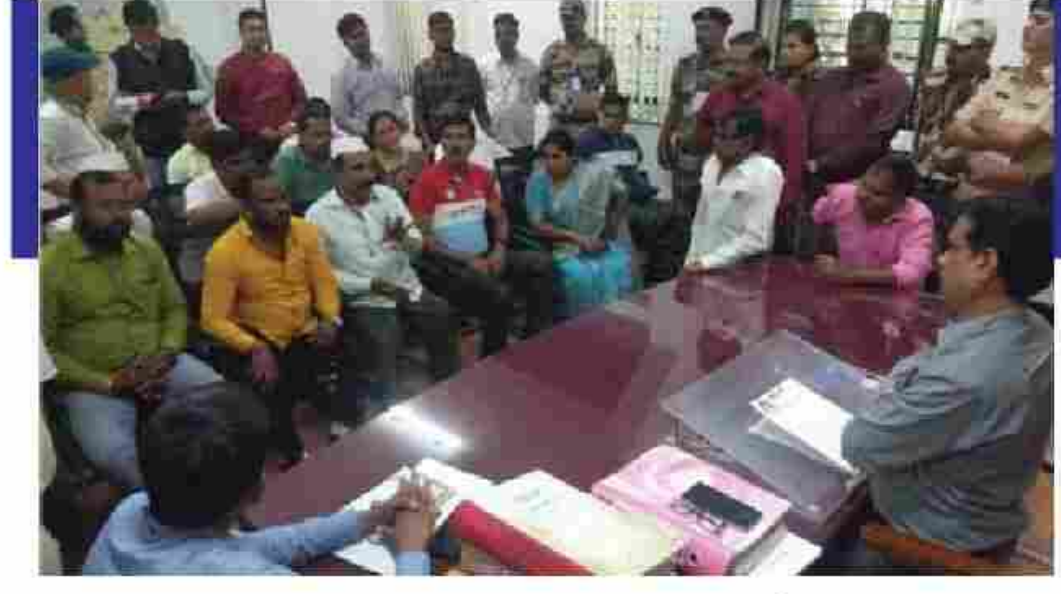
■ नाशिक, सधिन कदम :

प्रतिबंधात्मक उपाययोजना सुचविण्यासाठी शासनाने प्रधान सचिव (वने) महसुल व वन विभाग यांच्या अध्यक्षतेखाली एक समिती स्थापन करण्यात आली होती. त्यानंतर एका अभ्यासगटाने क्षेत्रीय भेटीदरम्यान स्थानिक शेतकरी यांच्याकडून उपलब्धी वन्यप्राणी फळझाडांस कशाप्रकारे उपद्रव करतात याबाबची माहिती घेतली.