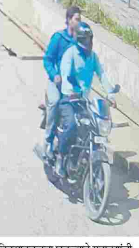
दिवसाढवळ्या घडल्याने महाटांगीची दहशत पसरली आहे. या घटनेतील दोन्ही आरोपी दुचाकीसह गावातील

■ नालासोपारा : भांडी, दागिने पोलिस करून देतो सांगून विरारच्या खानिवडेत एका दुकलाने वृद्धेला दिवसाढवळ्या लुटल्याची घटना घडली आहे. याप्रकरणी मांडवी पोलीस ठाण्यात गुन्हा दाखल करण्यात आला असून, पुढील तपास पोलीस करीत आहेत. दागिने स्वच्छ लखखीत करून देतो म्हणून दारावर दुचाकीने आलेल्या दोन पावडर विकणाऱ्या टांगीं घरात एकटी असलेल्या वृद्धेला दागिने चमकवून देण्याचा बहाण्याने लुटल्याची घटना वसई पूर्वे कडील ग्रामीण भागात