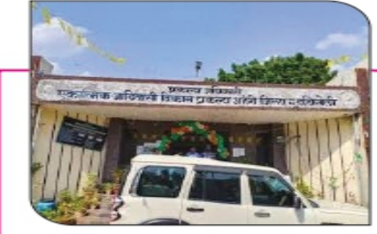
एकलव्य मॉडेल रेसिडेंशियल पब्लिक स्कूल... पान ३ वर....