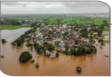
कर्नाटकच्या कृष्णाकाठ योजनेमुळे पश्चिम महाराष्ट्राला... पान ६ वर....