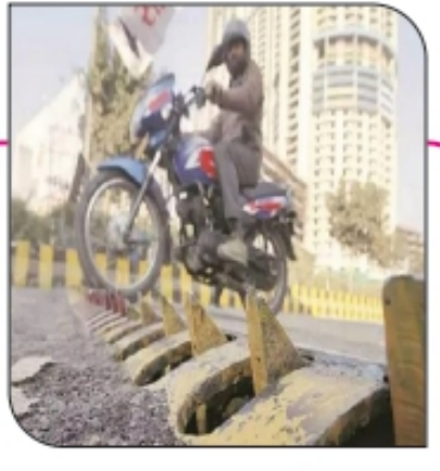
■ स्थानक परिसरात लवकरच 'टायर किलर'