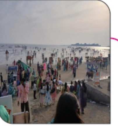
■ रायगड जिल्हातील पर्यटन स्थळे पर्यटकांनी गजबजली