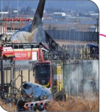
दक्षिण कोरियातील भीषण अपघातात १७९ प्रवासी ठार पान ६ वर...