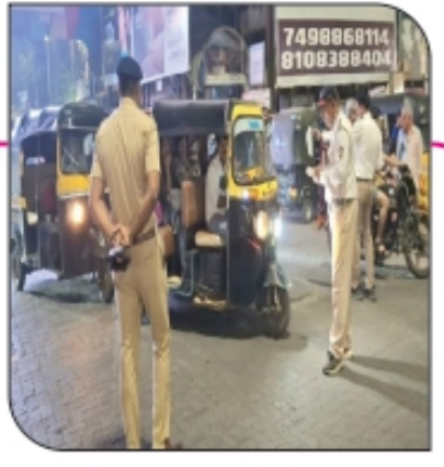
नियम मोडणाऱ्या बेशुस्त चालकांना दाखवला वाहतूक... पान ३ वर...