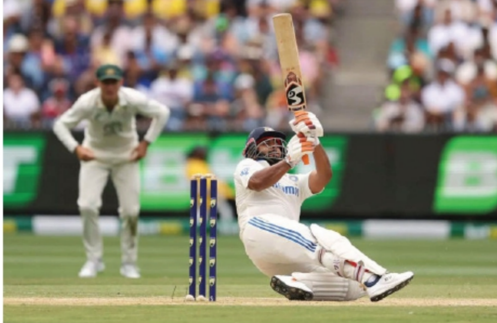
somewhere in the deep," Mark Waugh said on Fox Cricket. "It's just too hard of a shot and too risky of a shot to play with any degree of confidence and I'd be pulling him into line saying you didn't need to do that. If you're going to be attacking, run at the bowler and hit him over mid-off, I'd much rather that shot than that shot," he added. However, Waugh's

NEW DELHI : Rishabh Pant's dismissal on the third day of the Boxing Day Test at the MCG sparked a heated debate between two Australian legends over his shot selection. Pant tried to scoop Scott Boland to fine leg but ended up edging the ball, which was easily caught by Nathan Lyon at deep third man. "That's unacceptable. I know he's a very aggressive player and a player that is a bit out of the box and unpredictable but you've got to read the game situation and read the field. There were two men back for that exact shot so the percentages are not in your favour, unless you hit it for six you're going to be caught