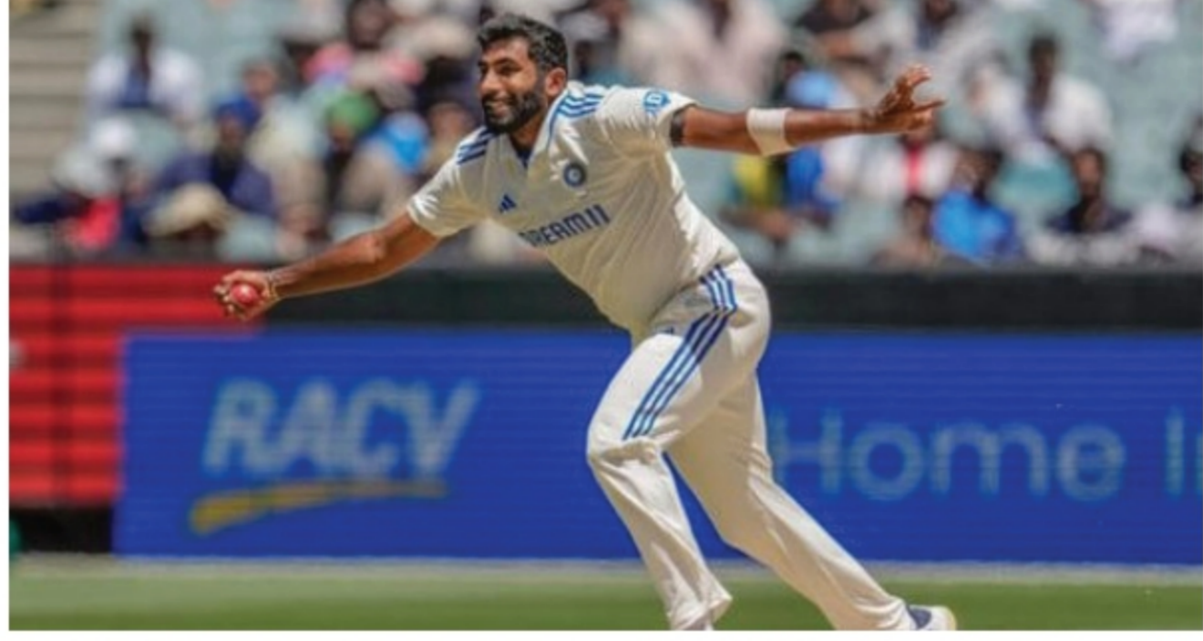
"The Greatest of all time is doing what he does best here at the 'G' .. #AUSvIND," Vaughan wrote. In reply, Lehmann said, "How good is he . Brilliant would have

kept the hosts on edge. The Indian vice-captain, who reached 200 Test wickets with the dismissal of Travis Head, was in full control, leaving the Australian batters scrambling for survival. Former cricketers, Michael Vaughan and Daren Lehmann, were in awe of Bumrah's brilliant spell in the second innings. Vaughan labelled Bumrah the 'greatest of all time', while Lehmann claimed the Indian pacer would've dismissed him 'twice' in three balls.