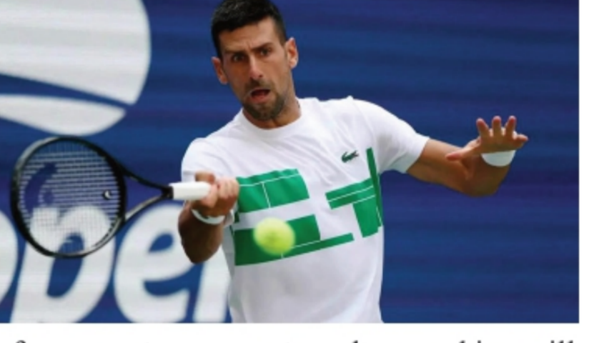
who have all retired. Jannik Sinner and Carlos Alcaraz have become prominent Grand Slam contenders. He will turn 38 in May next year, but Djokovic has no plans to retire. He seeks his 11th Australian Open title and a record 25th Grand Slam victory next month. "The way I'm feeling today, I still think that I can go strong for years to come," he said, though acknowledging uncertainty about his future motivation. "But how long I'm going to feel motivated to keep going is unpredictable. I still love this sport and I still love competing."

NEW DELHI : Novak Djokovic aims for more tournament wins and a higher ranking in 2025. He spoke in Brisbane, Australia, before the Brisbane International tournament this week. Djokovic, currently ranked seventh, wants to improve his consistency. "I'm looking for a good start to the season, I'm looking for more consistency across all the tournaments," he stated. He plans to play more tournaments than last year and hopes his performance will improve. "I'm looking to play more tournaments this year than I played last season, so hopefully also my level is going to go up. Hopefully I will win