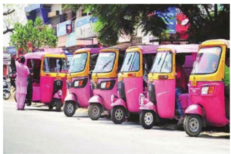
● पुणे, अभिजीत येरल्लू :

शहरातील गरजू महिलांना रोजगाराची संधी उपलब्ध करून देण्यासाठी गुलाबी (पिंक) रिक्षा खरेदी करण्यास अर्थसाहाय्य देण्याचा निर्णय महापालिकेने घेतला आहे. राज्य सरकारने नुकतीच 'पिंक ई रिक्षा' ही योजना राज्यात लागू केली आहे. त्याची अंमलबजावणी महापालिकेकडून केली जाणार आहे. ई-रिक्षाची किंमत तीन लाख ७३ हजार आहे. त्यापैकी लाभार्थी महिलांनी केवळ ३७ हजार ३०० रुपये भरायचे आहेत. शासनाकडून ७४ हजार ६०० रुपये दिले जाणार आहेत. या रिक्षासाठी कर्जाचा व्याजदर ९.३ अधिक २.७५ टक्के असून संबंधित महिलांनी पाच वर्षांमध्ये महिन्याला सहा हजार