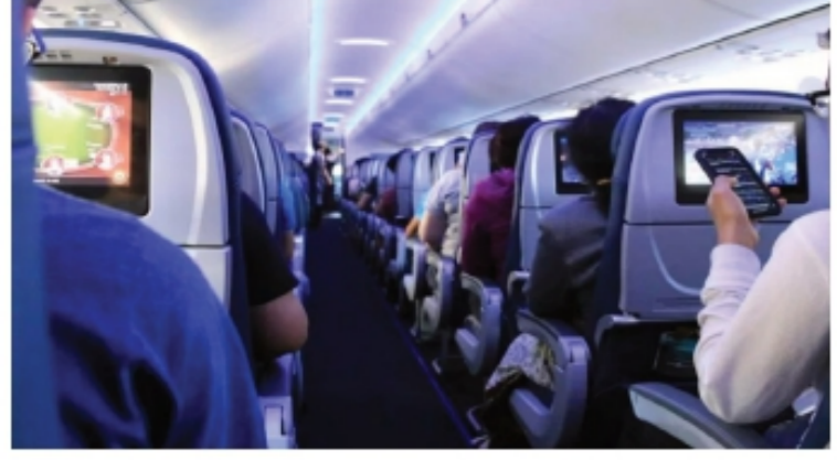
● नवी दिल्ली, प्रगती शर्मा :