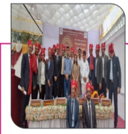
■ कल्याणात होणारे सुसज्ज आयसीए भवन शहरासाठी... पान ३ वर...