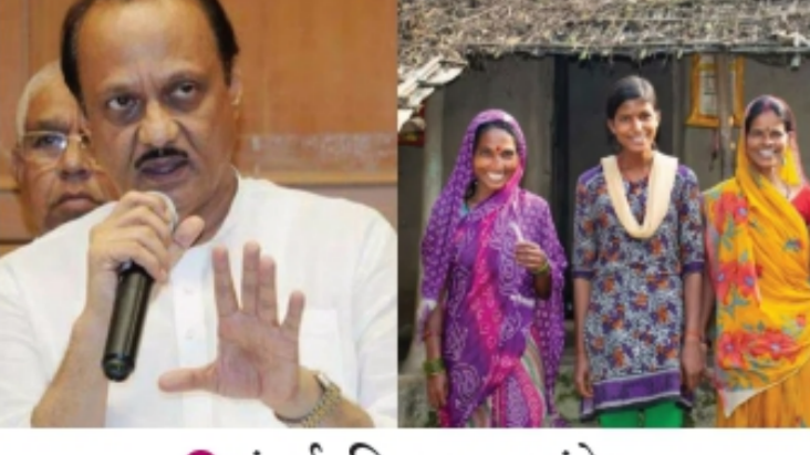
● मुंबई, विशाल कारंडे :

लाडकी बहीण योजना महायुतीला पुन्हा सत्तेत आणण्यासाठी महत्वाची ठरली होती. नोव्हेंबरमध्ये निवडणुकीची प्रक्रिया पार पडल्यानंतर नव्या वर्षाचे हमे कधीपासून सुरु होणार, याचीच उत्पुकता योजनेच्या लाभार्थी महिलांना लागली होती. तसेच योजनेबाबत अनेक शंकाकुशंका उपस्थित केल्या जात होत्या. योजनेसाठी निकष लावले जाणार असून अनेक महिला अपात्र ठरू शकतात, अशीही चर्चा मध्यंतरी होती. यावर