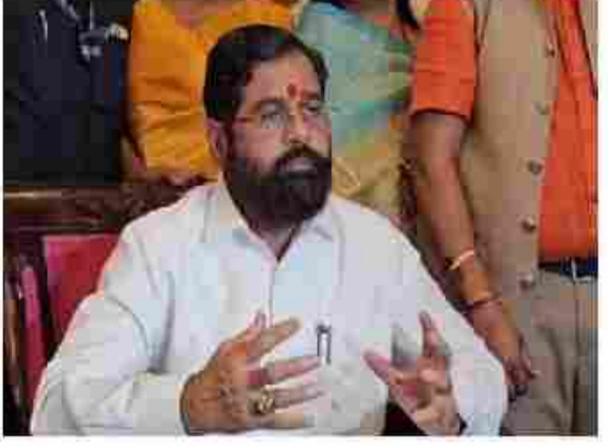
सातारा, विशेष प्रतिनिधी :

मराठा समाजाला दिलेले आरक्षण टिकणार नाही, असे काहीजण सांगत आहेत. परंतु, का टिकणार नाही, याची कारणे मात्र ते देत नाहीत. वास्तविक आरक्षण कस टिकेल यावर सकारात्मक चर्चा झाली पाहिजे. हातात संधी होती, त्यावेळी त्यांनी संधीचे सोने केले नाही, असा टोला मुख्यमंत्री एकनाथ शिंदे यांनी विरोधकांना लगावला. मुख्यमंत्री शिंदे यांनी खासदार उदयनराजे भोसले यांच्या जलमंदीर निवासस्थानी भेट दिली. यावेळी त्यांनी पत्रकारांशी संवाद साधला. शिंदे म्हणाले, मराठा समाज गेल्या अनेक वर्षांपासून आरक्षण मागतोय. या समाजाला आरक्षण देण्यासाठी चार लाख कर्मचारींची टीम लावली. दिवसरात्र काम केले. सर्वोच्च न्यायालयाने जी निरीक्षणे नोंदवली, ज्या तुटी सांगितल्या त्या पुणे दूर केल्या. अत्यासपूर्ण सर्व्हेक्षणानुसार मराठा समाजाचे आर्थिक व सामाजिक मागसलेपण सिद्ध केले.