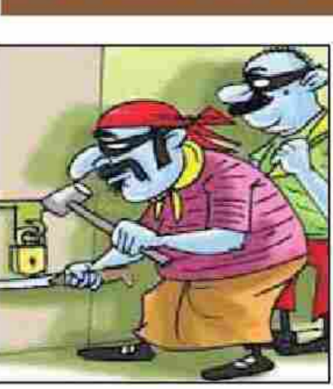
रिश्का टाण्यात असल्याचे निदर्शनास आले. त्यानंतर पोलिसांनी तेथील