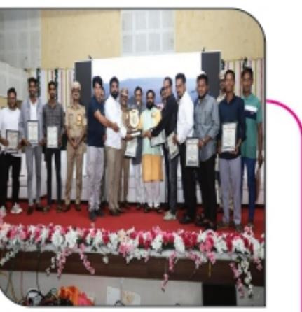
■ अपघातग्रस्तांना शासनामार्फत सर्वोत्तरी... पान ६ वर...