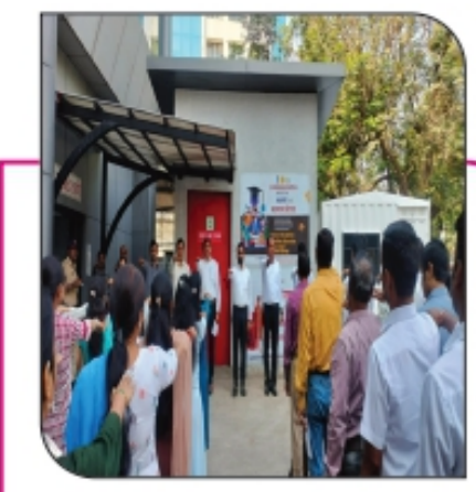
■ जिल्हा परिषदेत 'राष्ट्रीय मतदार दिवस' साजरा पान ३ वर...