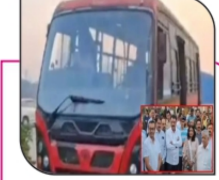
डॉबिवलीतील रुग्णवाला गार्डन ते वाशी, डॉबिवली रेल्वे स्थानक... पान ३ वर...