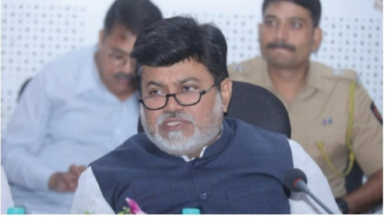
● पुणे, अभिजीत घेरलू :

सामंत यांनी पत्रकारांशी बोलताना सांगितले. या विषयासंदर्भात पोलीस अधीक्षकांच्या बैठकीनंतर आवश्यकता भासल्यास शासन अध्यादेश काढण्यात येईल, असेही त्यांनी स्पष्ट केले.