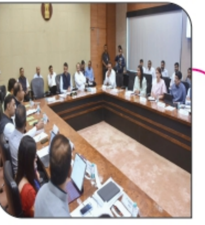
मुख्यमंत्र्यांनी घेतला प्लॅगशीप योजनांचा आढावा प्रधानमंत्री... पान ६ वर...

सहसंपादक - अनिकेत घनश्याम भंकाळ | वर्ष - ०२ | अंक २३६ | पृष्ठे - ०६ | ठाणे, मंगळवार, ०४ फेब्रुवारी २०२५ | रु. २/- | RNI.REG. NO. MAHBIL/2023/86118