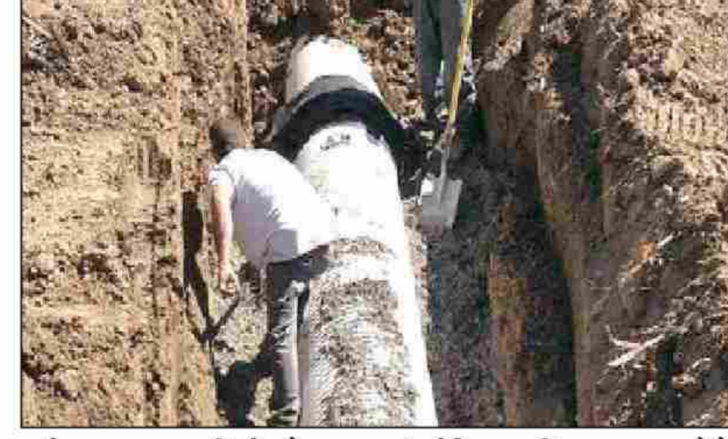
नवीन टाकण्याचा निर्णय घेण्यात आला आहे. या वाहिन्यांचे मजबुतीकरण केले जाणार आहे. पालिकेच्या या प्रकल्पामुळे

मुंबई : मुंबईचा विकास झपाट्याने होत असून, मूलभूत सुविधा वाढवण्यावर पालिका प्रशासनाने भर दिला आहे. मुंबईत सुमारे २ हजार २६ किलोमीटर लांबीचे मलनिस्सारण वाहिन्यांचे जाळे आहे. बहुतांशी मलनिस्सारण जलवाहिन्या जुन्या झाल्या आहेत. या वाहिन्यांचे जाळे विस्तारण्यासह मजबुतीकरण केले जाणार आहे. यासाठी अद्ययावत तंत्रज्ञानाचा वापर करण्याचा निर्णय पालिका प्रशासनाने घेतला आहे. मुंबई महापालिका यासाठी तब्बल ६०० कोटी रुपये खर्च करणार आहे. मलनिस्सारण प्रचलन विभागामार्फत शहर आणि उपनगरात २२५ ते १०० मिमी व्यासाच्या मलनिस्सारण वाहिन्या नव्याने टाकल्या जाणार आहेत. तसेच नवीन मलनिस्सारण वाहिन्यांची जोडणी, एकत्रीकरण अशा विविध स्वरूपाची कामे केली जाणार आहेत. मुंबईतील बहुतांश मलनिस्सारण वाहिन्या ब्रिटिशकालीन असून, त्या जीर्ण झाल्या आहेत. जीर्ण झालेल्या मलनिस्सारण वाहिन्या बदलत