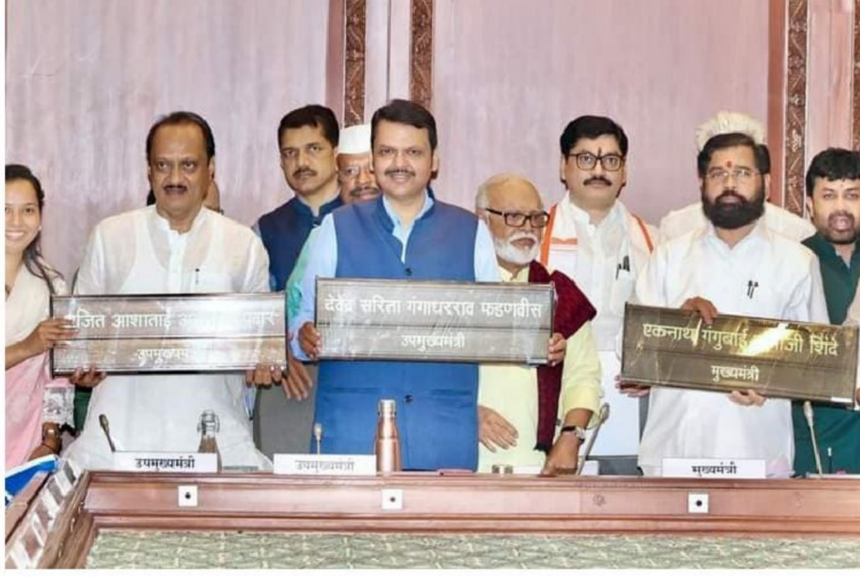
शासनाशी विचारविनिमय करावा. तसेच केंद्र शासनाकडून याबाबत

सरकारी दस्तऐवजांवर आता आईचे नाव लावणे बंधनकारक असणार आहे. १२ मे २०२४ रोजी व त्यानंतर जन्मलेल्या सर्व बालकांच्या नावाची नोंद बालकाचे नाव आईचे नाव नंतर वडिलांचे नाव व आडनाव अशा स्वरूपात लावावे. असा निर्णय मंत्रिमंडळाच्या बैठकीत घेण्यात आला आहे. सर्व कागदपत्रे, महसूली दस्तऐवज, वेतन चिठ्ठी, सेवापुस्तक, विविध परीक्षांच्या अजाचे नमुने इत्यादी शासकीय दस्तऐवजांमध्ये आईचे नाव लावणे बंधनकारक करण्यास मान्यता देण्यात आली आहे. सार्वजनिक आरोग्य विभागाने जन्म-मृत्यू नोंदवहीत आवश्यक त्या सुधारणा करून नोंद घेण्यासाठी केंद्र