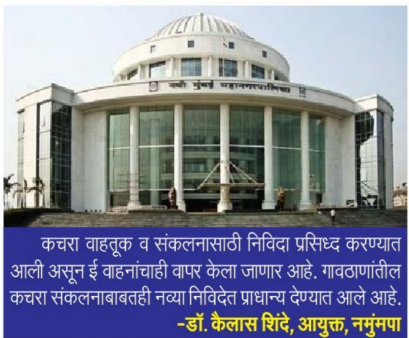
कचरा वाहतूक व संकलनासाठी निविदा प्रसिद्ध करण्यात आली असून ई वाहनांची वापर केला जाणार आहे. गावठाणीतील कचरा संकलनाबाबतही नव्या निविदेत प्राधान्य देण्यात आले आहे.