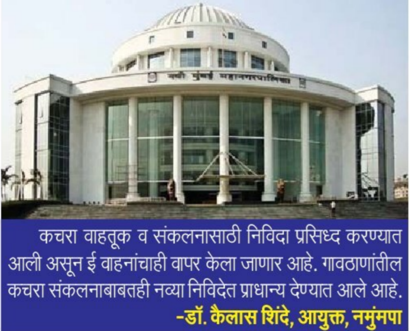
कचरा वाहतूक व संकलनासाठी निविदा प्रसिद्ध करण्यात आली असून ई वाहनाची वापर केला जाणार आहे. गावठाणीतील कचरा संकलनाबाबतही नवी निविदेत प्राधान्य देण्यात आले आहे.

■ नवी मुंबई : प्रतिनिधी, स्वच्छ शहरात नवी मुंबई चा समावेश होत असून महापालिकेने कचरा वर्गीकरणाने व्यापती वाढवण्याची तयारी सुरू केली आहे. मागील वर्षभरपासून सातत्याने मुदतवाढ देण्यात येणाऱ्या कचरा वाहतूक व संकलनाची निविदा पालिकेने प्रसिद्ध केली असून पालिकेच्या इतिहासात प्रथमच कचऱ्याची ई-वाहतूक सुविधाही राबवली जाणार आहे. १३ मेपर्यंत निविदा स्वीकारण्याची मुदत देण्यात आली. आतापर्यंत कचरा वाहतूक व संकलनासाठी वारंवार जुन्या ठेकेदाराला मुदतवाढ दिली जात होती. त्याचच पालिकेला अखिल भारतीय स्थानिक स्वराज्य संस्थेकडून प्रकल्प अहवाल प्राप्त होण्यासाठी बराच कालावधी लागला होता. त्यामुळे आता पालिकेने या कामाबाबत निविदा काढली असून मागील काम हे २४०० रुपये टनाप्रमाणे देण्यात आले होते. त्यामुळे यावेळी निविदा किती कोटीपर्यंत जाणार हे लवकरच स्पष्ट होणार आहे. पालिकेने कचरा वाहतूक व संकलनासाठी मार्च २०१५ ते मार्च २०२२ पर्यंत शहरातील कचरा वाहतूक व संकलनाच्या ठेकेदाराला काम दिले होते.