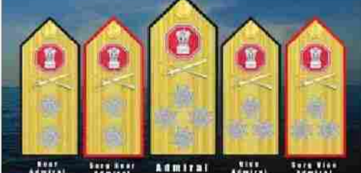
नौदल दिनी पंतप्रधान नरेंद्र मोदी यांनी या बदलाची घोषणा केली होती.