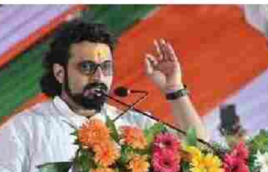
डॉ. अमोल कोल्हे