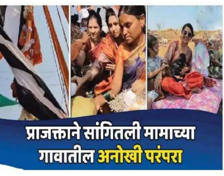
प्राजक्ताने सांगितली मामाच्या गावातील अनोखी परंपरा