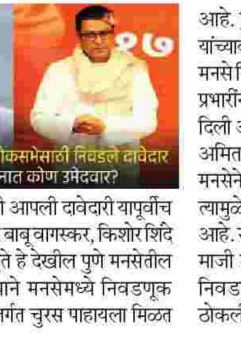
अमित ठाकरेची पुणे लोकसभेसाठी निवडलेले दावेदार राज ठाकरेच्या मनात कोण उमेदवार?