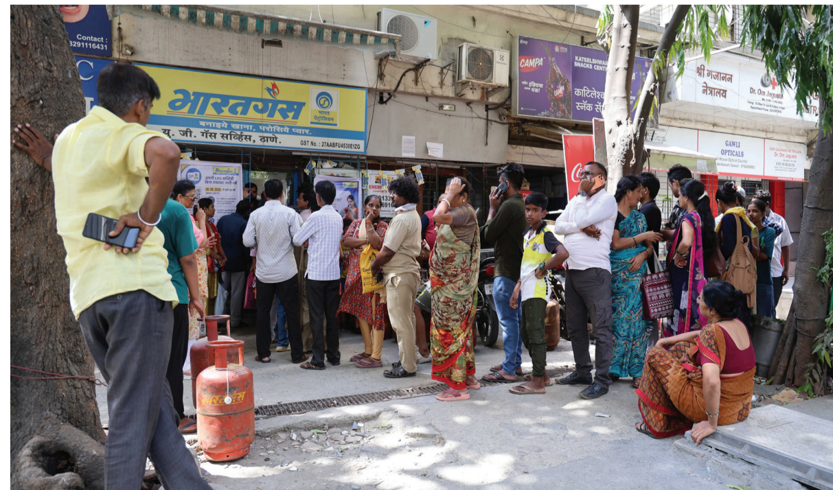
ठाणे : घरगुती गॅस सिलेंडर मिळविण्यासाठी एजन्सीसमोर ग्राहकांची गर्दी