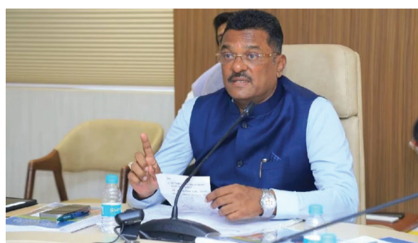
होणे आवश्यक आहे, असे सरनाईक यांनी मराठी भाषेचे महत्त्व अधोरेखित करताना पत्रात नमूद केले आहे. मुंबई महानगर क्षेत्रासह राज्यातील विविध भागांमध्ये

भाषेचे संवर्धन होण्याबरोबरच समाजातील परस्पर संवाद अधिक सुसंवादी, आत्मीय आणि परिणामकारक बनेल, असे सरनाईक यांनी पत्रात म्हटले आहे. भाषा ही केवळ शब्दांची देवाणघेवाण नसून ती संस्कृती, परंपरा, मूल्ये आणि सामाजिक ओळख जपणारी एक माध्यम आहे. त्यामुळे मराठी भाषेचा दैनंदिन व्यवहारात अधिकाधिक वापर